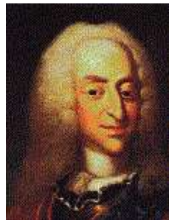
Christian VI, regent fra 1730 - 1746

Det lokale selvstyre har gammel hævde i Danmark. Det betød blandt andet, at bønderne (bymændene) i en landsby havde ret til indbyrdes at afgøre sager, der væsentligst vedkom dem selv. Selvstyret var baseret på en af bymændene i fællesskab udarbejdet vedtægt.