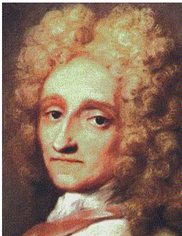
Frederik IV, regent fra 1699 - 1730