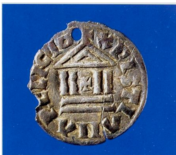
Bagside af Ludvig den Fromme-mønt

Karolingisk mønt slået af Ludvig den Fromme På forsiden ses kors og kejsernavn, på bagsiden en bygning med omskrift "Christiana Religio" (Den kristne religion).