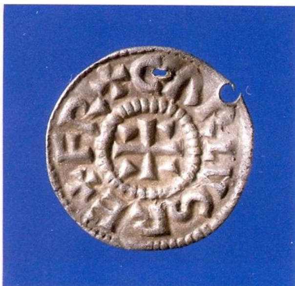
Forside af Karl den Store-mønt