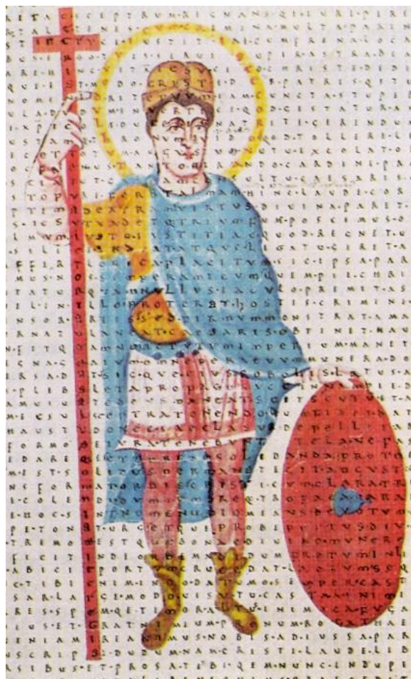
Ludvig den Fromme