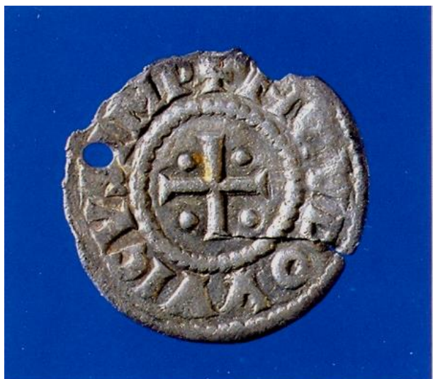
Forside af Ludvig den Fromme-mønt