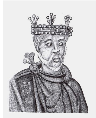
Karl II den Skaldede