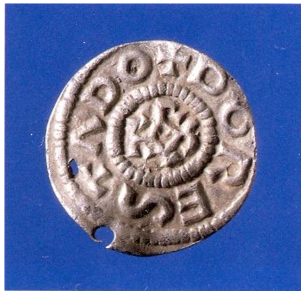
Bagside af Karl den Store-mønt

Karolingsk mønt slået af Karl den Store.