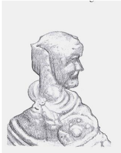
Ludvig den Tyske