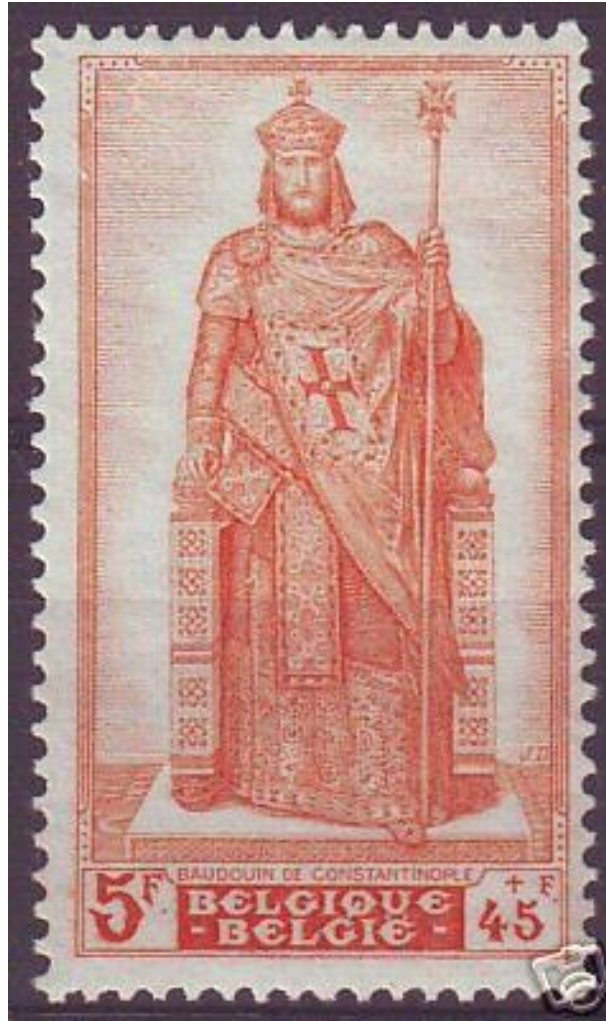
Boudewijn I Van Constantinopel