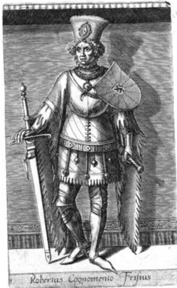
Robrecht I van Vlaanderen

Robrecht I van Vlaanderen, også kaldet Robrecht de Fries er født omkring 1030 som den næstældste søn af Boudewijn V van Vlaanderen og Adela van Frankrijk (ane nr. 3522572992).