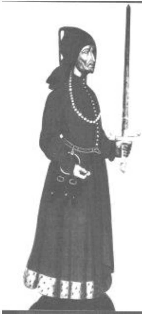
Karel van Denemarken = Karel de Goede

Karl af Danmark, senere kaldt Karl den Gode bliver født omkring 1080 som søn af den danske konge Knud (II) den Hellige og Edel (Adela) af Flandern.