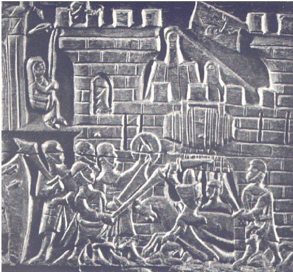
Scene fra Gyldensporeslaget i Courtrai (Kortrijk) 11.jul.1302

Gwijde Van Dampierre blev født i 1226 som næstældste søn af Willem I af Dampierre og Margaretha II af Constantinopel.