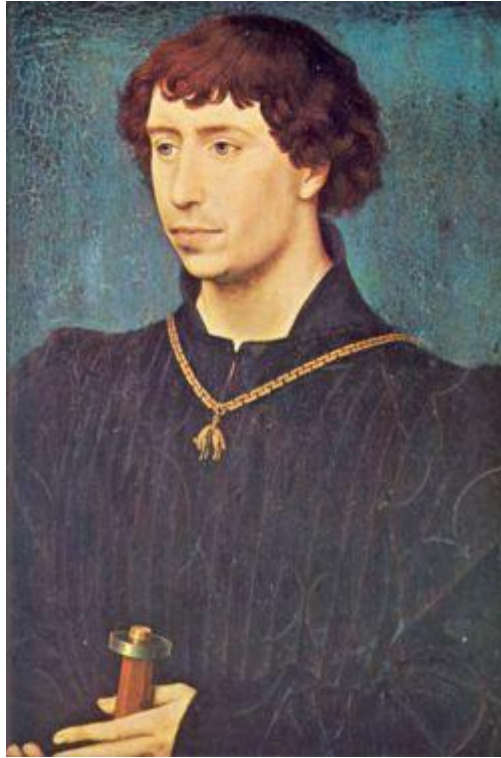
Karl den Dristige

Efter Philip's død i 1467 arvede hans søn Karl den Dristige alle faderens besiddelser.