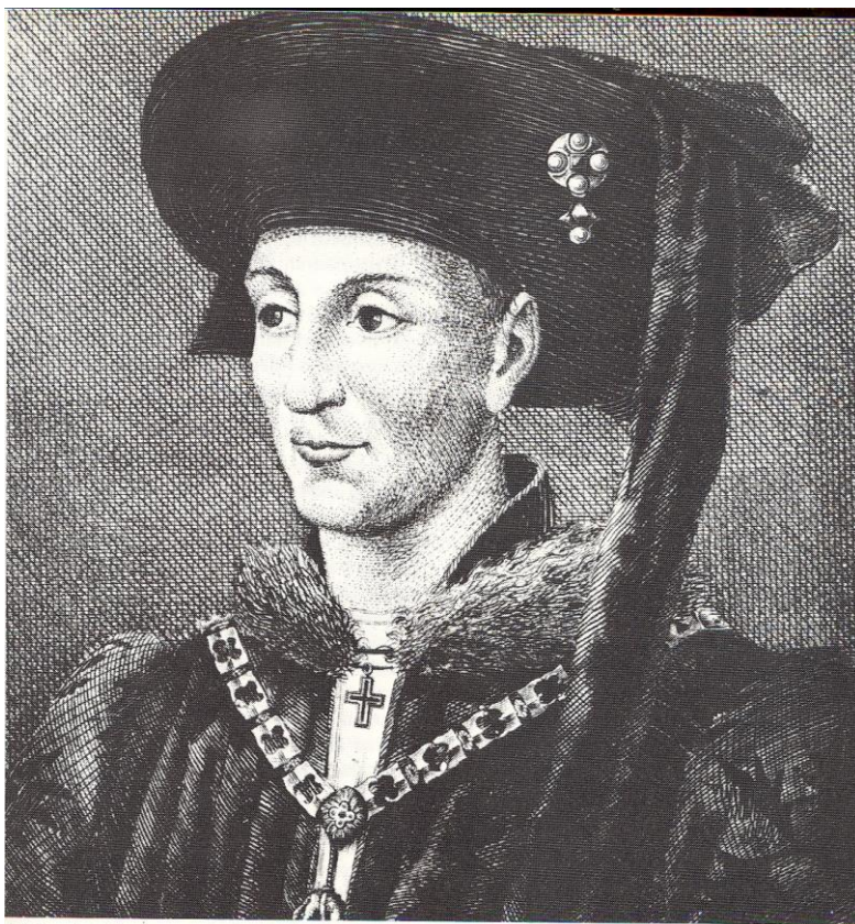
Philip den Gode - ønskede magt i Frankrig, men kom i stedet til at styrke Burgund.