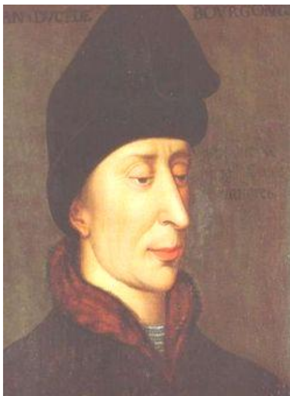
Jan den Frygtløse

Philip døde i 1404 og efterfulgtes af sin søn Jan den Frygtløse.