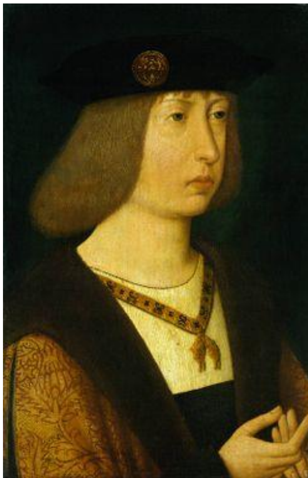
Philip den Smukke

I 1493 overtog Maximilian kejserværdigheden efter sin far. Året efter overlod han Nederlandene til sin 16-årige søn Philip. Provinserne kunne derefter en tid glæde sig over igen at have en indført fyrste, som - så vidt det var muligt - handlede til deres bedste.