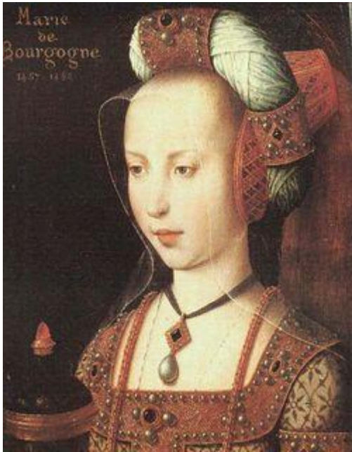
Marie af Burgund