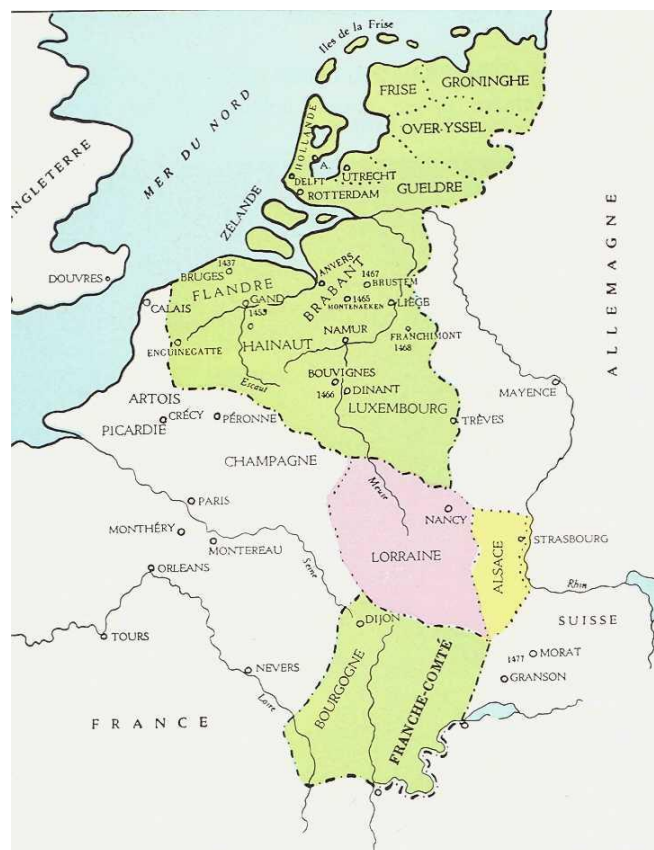
Philip den Gode's besiddelser i 1450

De eneste områder inden for de nuværende lande Belgien, Holland og Luxemburg, som han nu ikke var herre over, var bispesyrstendømmerne Liège og Utrecht. Det havde dog ikke den store betydning, da han sørgede for at få betroede mænd anbragt som biskopper.