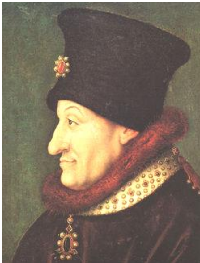
Philip den Dristige

Philip den Dristige var født den 17. jan 1342 som den yngste søn af kong Jan (Jean) II af Frankrig.