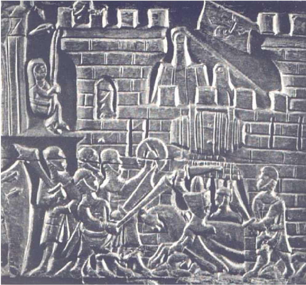
Scene fra Gyldensporeslaget i Courtrai (Kortrijk) 11.jul.1302

Gwijde Van Dampierre blev født i 1226 som næstældste søn af Willem I af Dampierre og Margaretha II af Constantinopel.