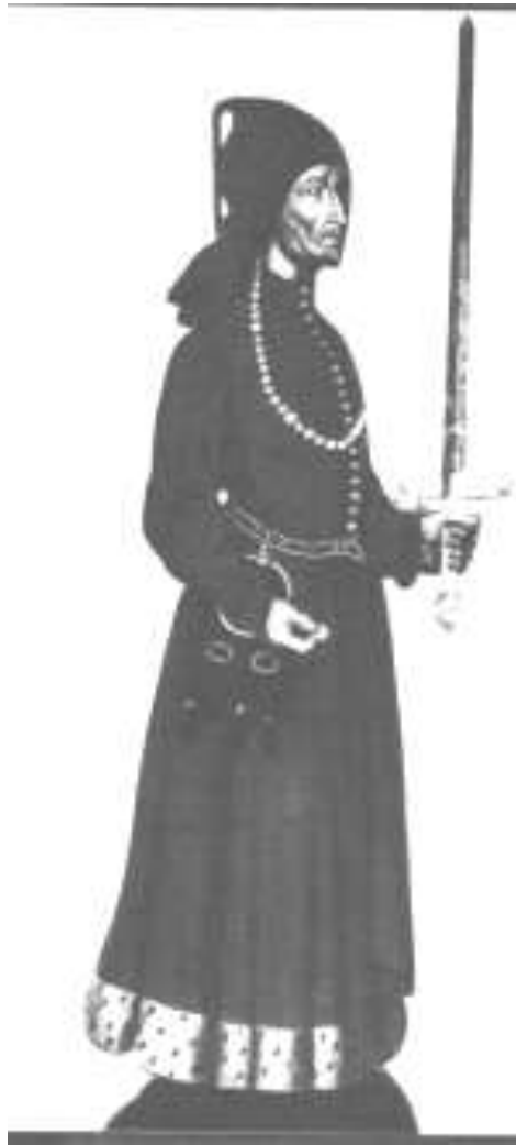
Karel van Denemarken = Karel de Goede

Karl af Danmark, senere kaldt Karl den Gode bliver født omkring 1080 som søn af den danske konge Knud (II) den Hellige og Edel (Adela) af Flandern.