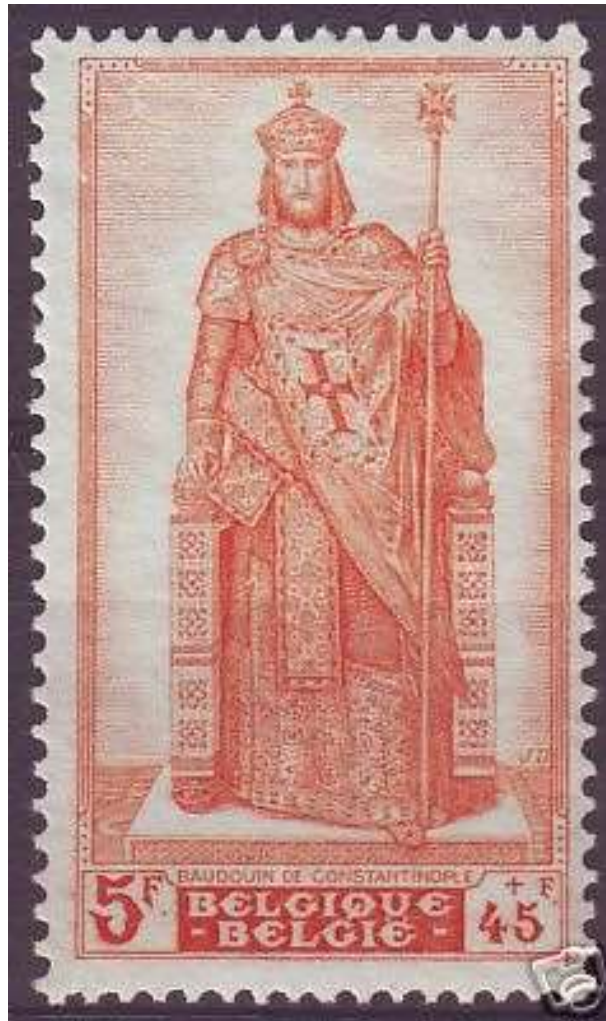
Boudewijn I Van Constantinopel