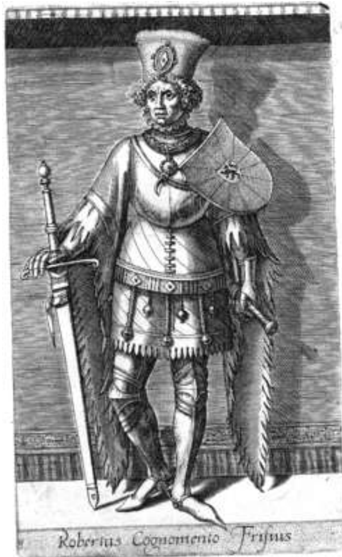
Robrecht I van Vlaanderen

Robrecht I van Vlaanderen, også kaldet Robrecht de Fries er født omkring 1030 som den næstældste søn af Boudewijn V van Vlaanderen og Adela van Frankrijk (ane nr. 3522572992).