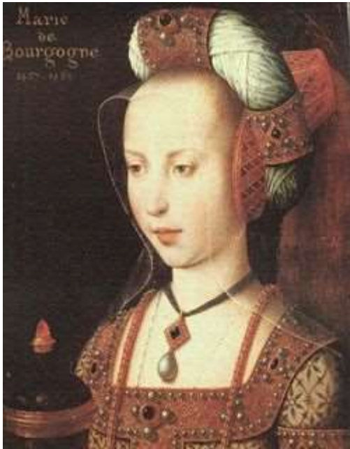
Marie af Burgund