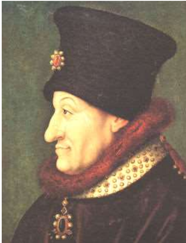
Philip den Dristige

Philip den Dristige var født den 17. jan 1342 som den yngste søn af kong Jan (Jean) II af Frankrig.