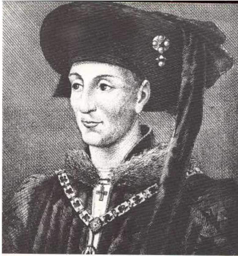
Philip den Gode - ønskede magt i Frankrig, men kom i stedet til at styrke Burgund.