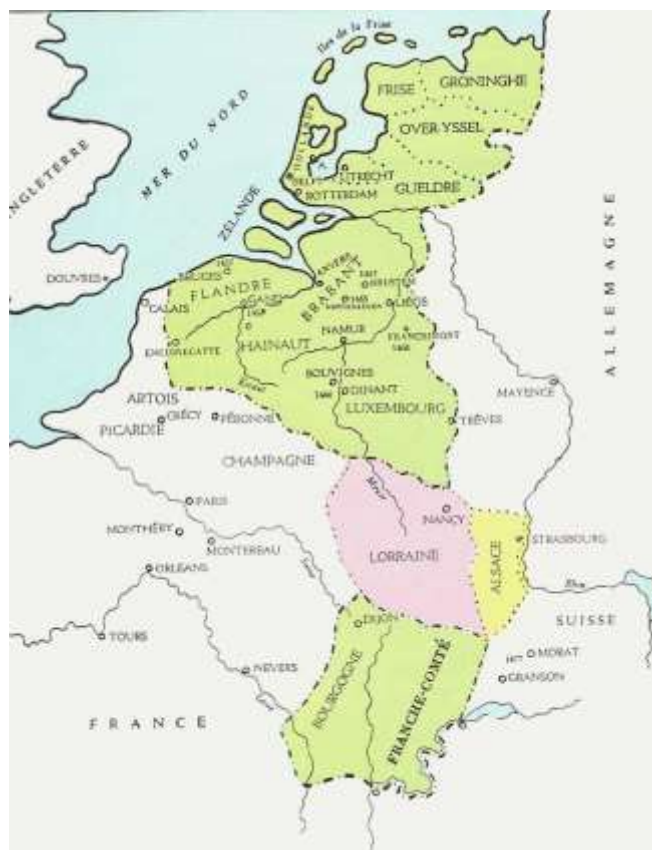
Philip den Gode's besiddelser i 1450

De eneste områder inden for de nuværende lande Belgien, Holland og Luxemburg, som han nu ikke var herre over, var bispesyrstendømmerne Liège og Utrecht. Det havde dog ikke den store betydning, da han sørgede for at få betroede mænd anbragt som biskopper.