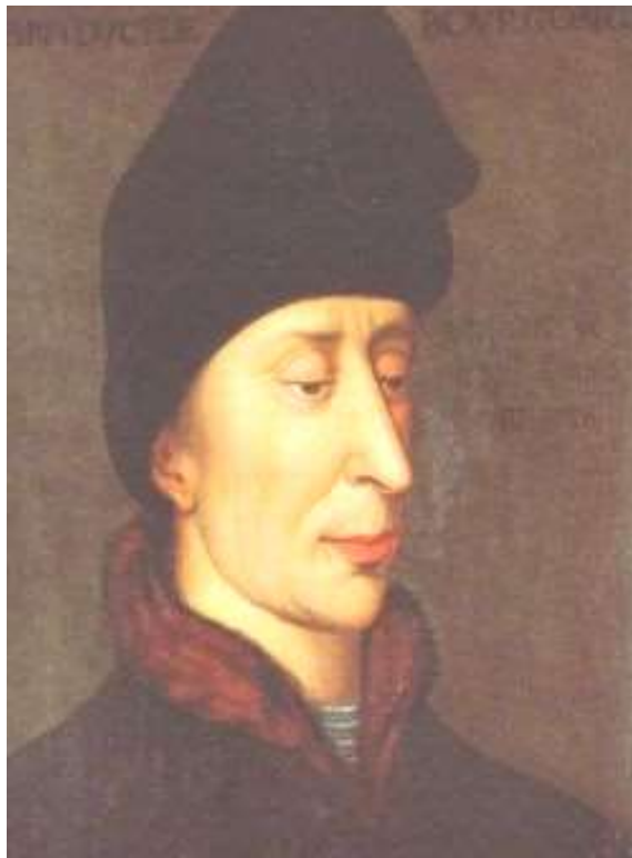
Jan den Frygtløse

Philip døde i 1404 og efterfulgtes af sin søn Jan den Frygtløse.