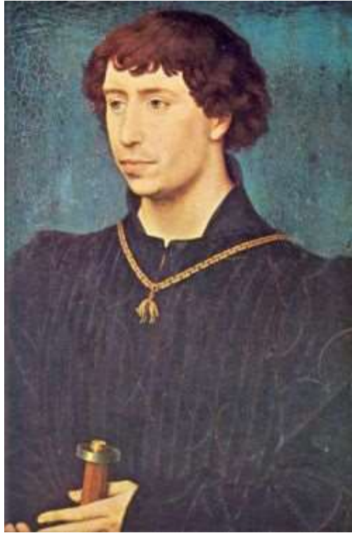
Karl den Dristige

Efter Philip's død i 1467 arvede hans søn Karl den Dristige alle faderens besiddelser.