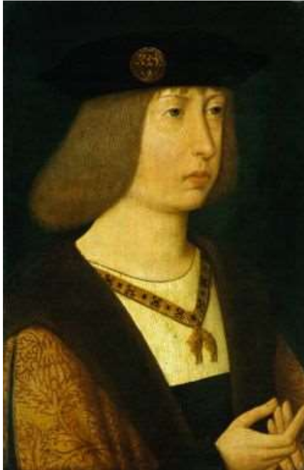
Philip den Smukke

I 1493 overtog Maximilian kejserværdigheden efter sin far. Året efter overlod han Nederlandene til sin 16-årige søn Philip. Provinserne kunne derefter en tid glæde sig over igen at have en indført fyrste, som - så vidt det var muligt - handlede til deres bedste.