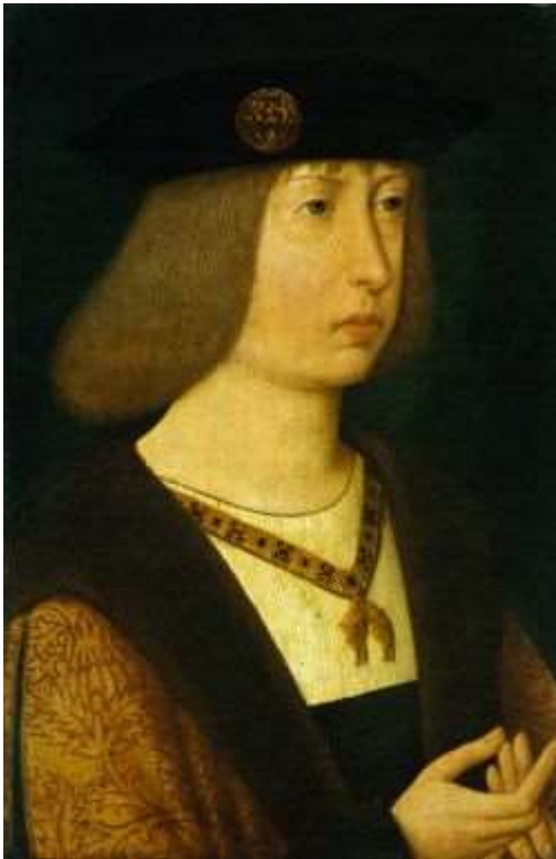
Philip den Smukke