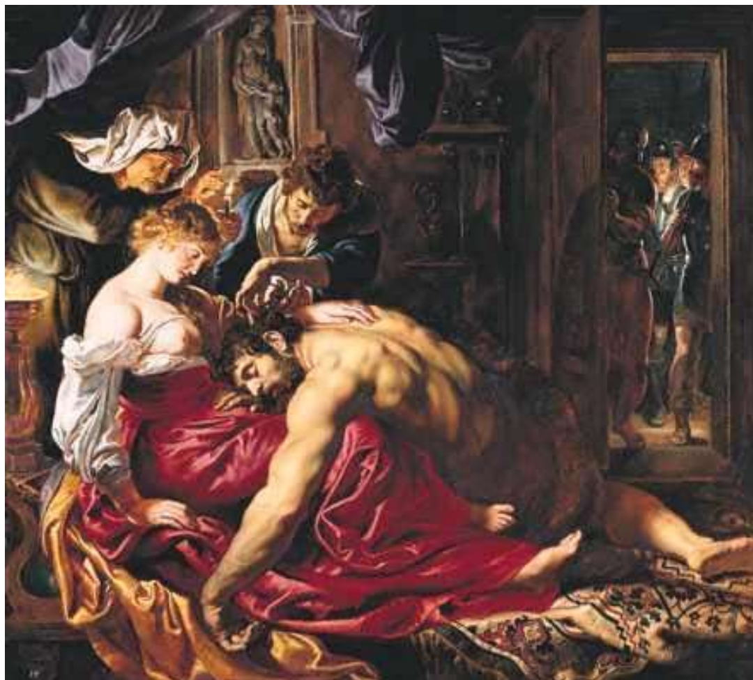
Samson og Dalila