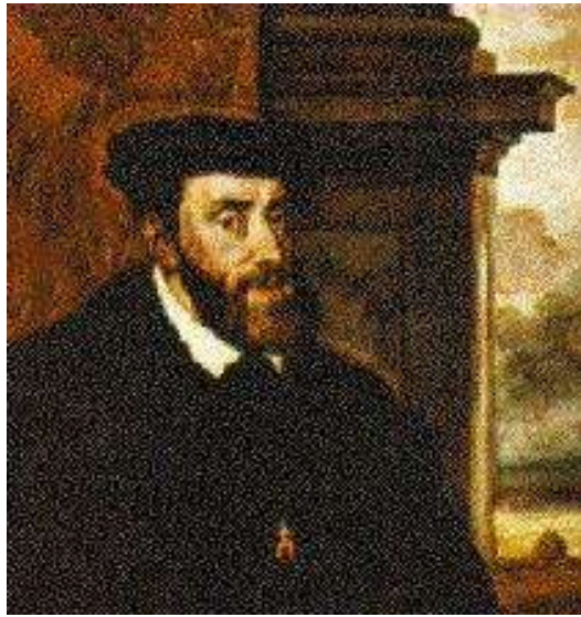
Kejser Karl V, 1500-1558