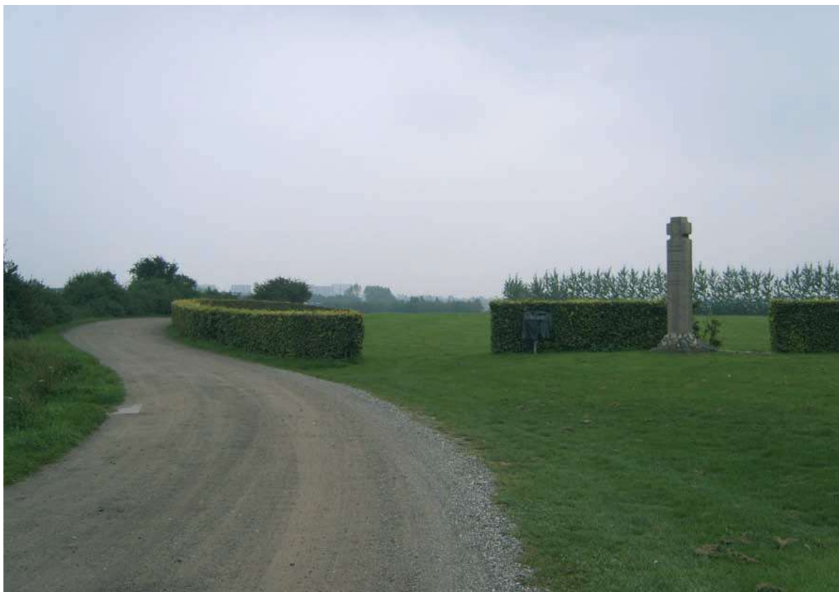
Kirketomten, hvor Ullerup kirke lå indtil nedrivningen i 1655-1656, set fra nord