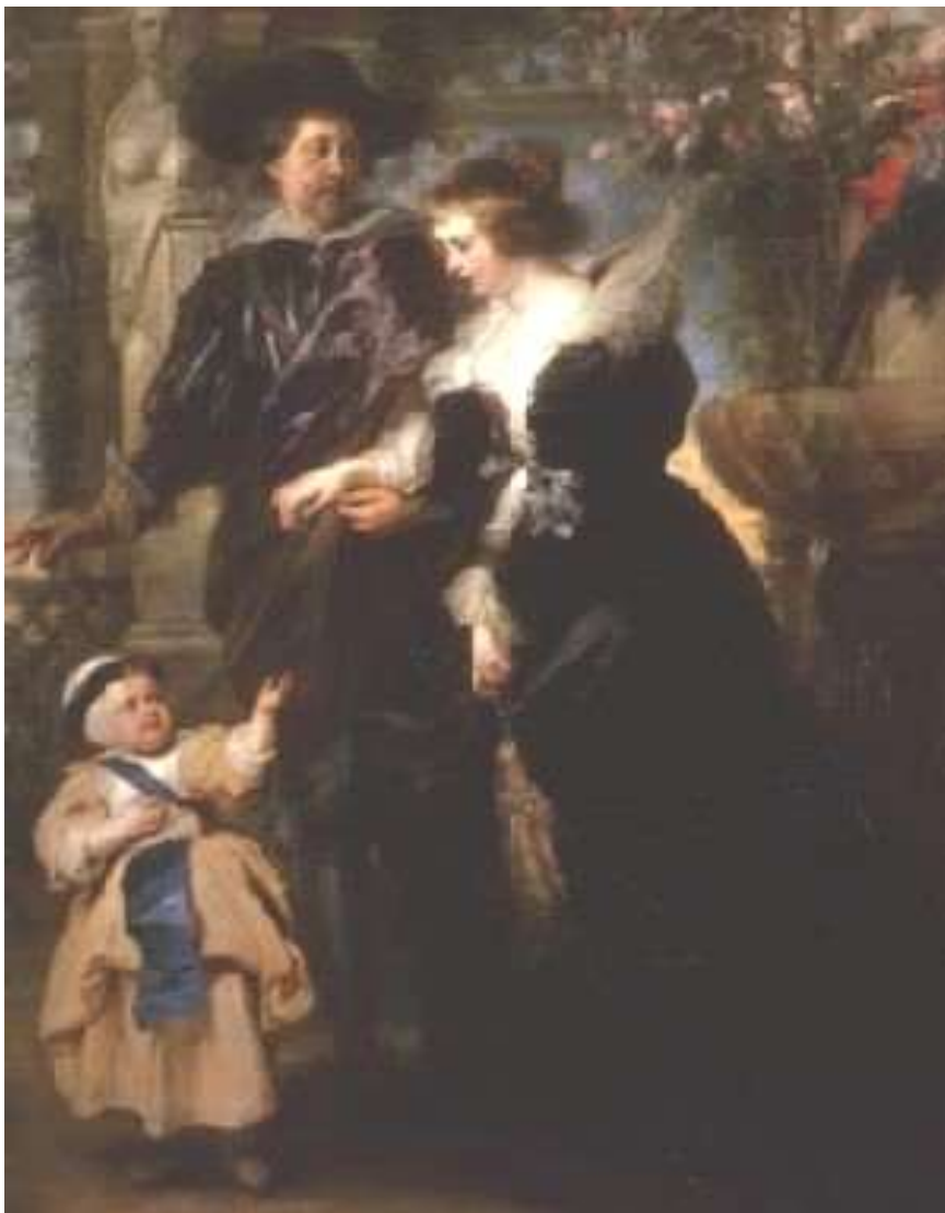
Pierre Paul Rubens med hustru og søn.