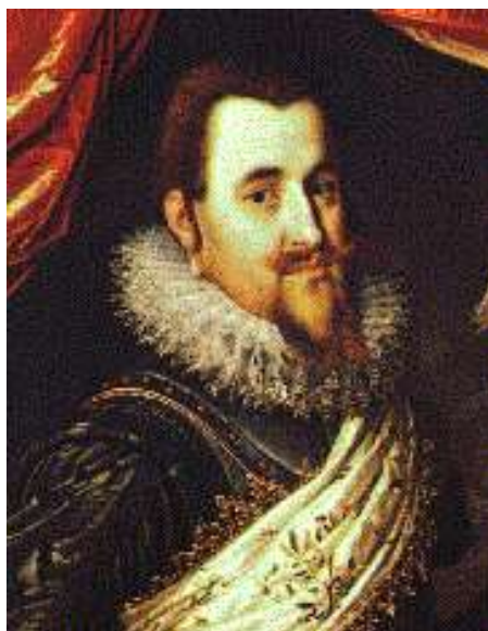
Christian IV af Danmark

Både Felipe IV og Christian IV levede i et Europa i opbrud. Trediveårskrigen fra 1618 til 1648 blev skelsættende for dem begge.