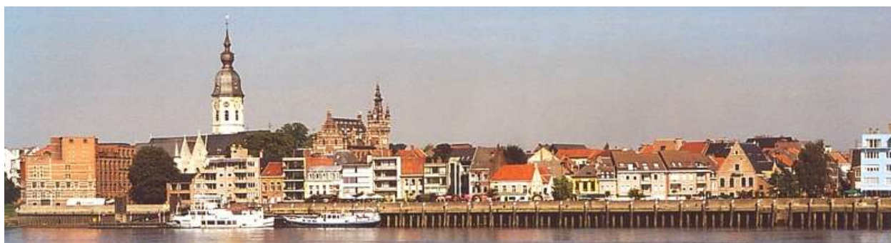
Temse omkring år 2000