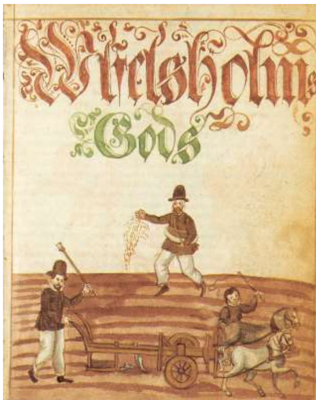
Tegning i jordebog over Ulfeldtsholm gods