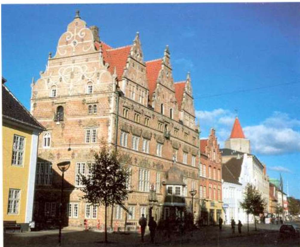
Jens Bangs stenhus i Ålborg