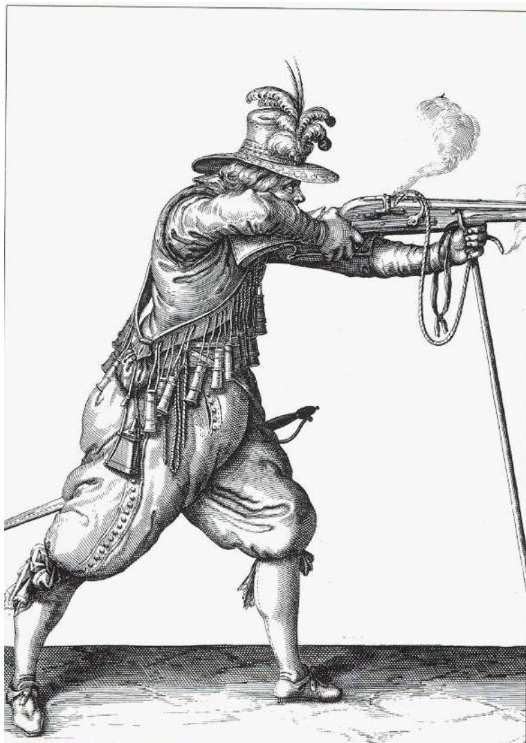
Musketer med musket og tilhørende forketstok.