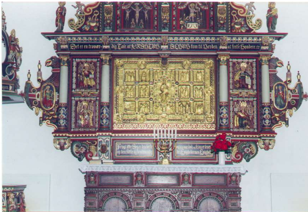
Stadil kirkes klenodie, "det gyldne alter".

I midten den tronende Kristus. I 6 af de 12 firkantede felter omkring ham ses forskellige apostle, i de øvrige 6 ses scener fra Jesu barndom. I de fleste runde felter i kanten ses engle.