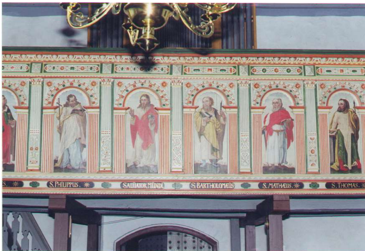
Orgelpulpitret i Stadil kirke, et renæssancearbejde, formentlig fra omkring 1650.