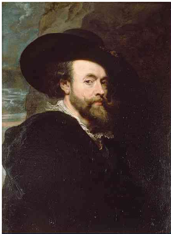
Pierre Paul Rubens

Pierre Paul Rubens er en af barokkens mest berømte malere. Han blev født i Westfalien i 1777.