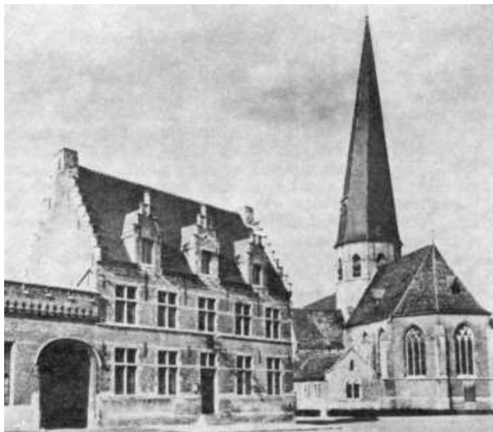
"De Eenhorn" (Enhjørningen) ved siden af Bazel kirke