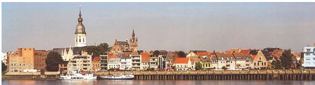
Temse omkring år 2000