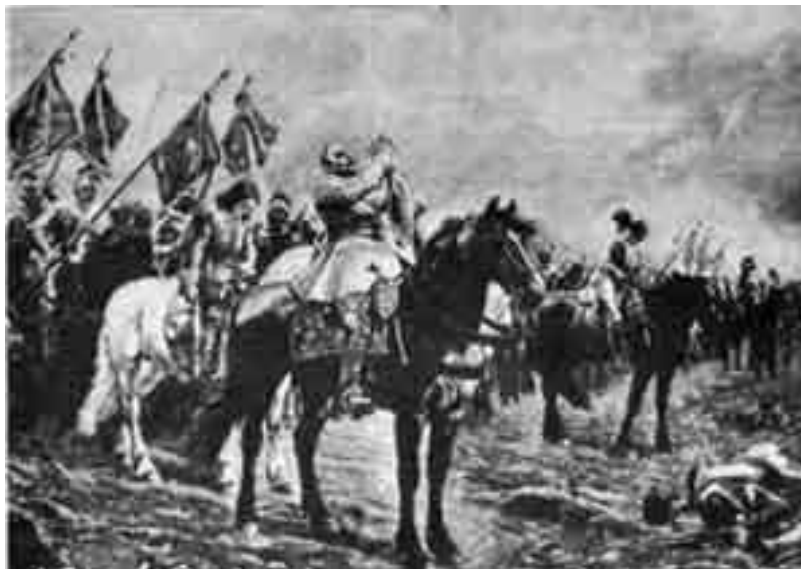
Den svenske kong Gustav II Adolf under slaget ved Lützen 1632