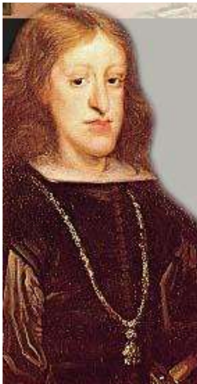
Carlos (Karl) II af Spanien