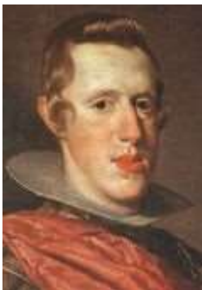
Felipe IV af Spanien