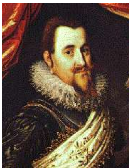
Christian IV af Danmark