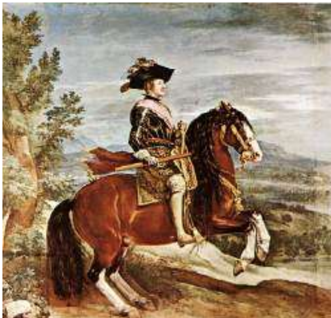
Maleri af Felipe IV