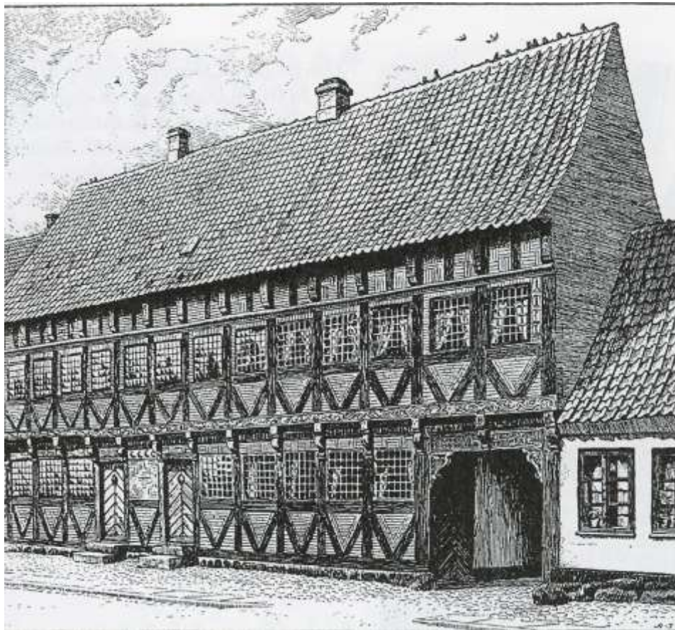
Købmandshuset fra 1644, beliggende Vestergade 16 i Køge

Skatteopkrævning er ikke et nyt fænomen.