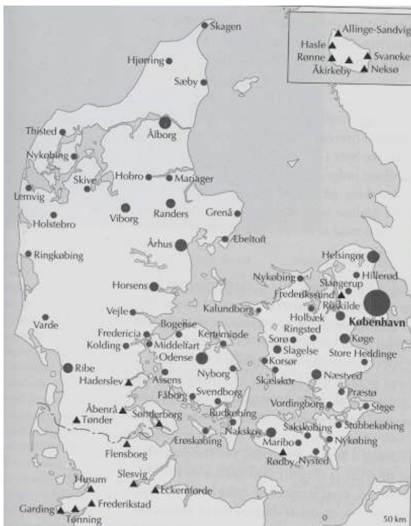
De danske og slesvigske købstæder 1672