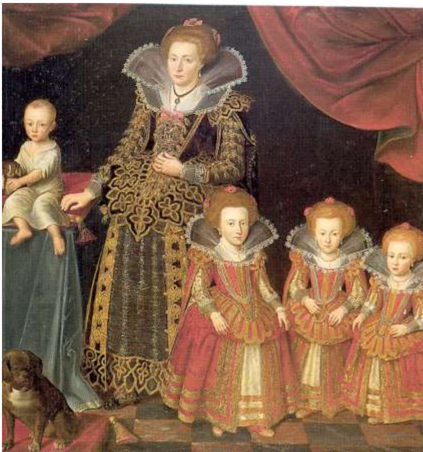
Kirsten Munk i 1623 med børn, heriblandt Leonora Christiana og Valdemar Christian (tv.)

Christian IV blev i 1597 gift med Anna Cathrine af Brandenburg.