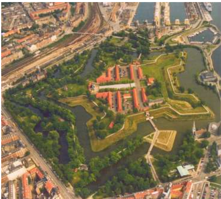
Kastellet i København i år 2000

Oprindelsen til Kastellet kan dateres til Christian IV's udbygning af København med en vold uden om Rosenborg Slot til Sankt Annæ Skanse på havnens nordside.