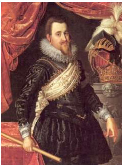
Christian IV i 1611