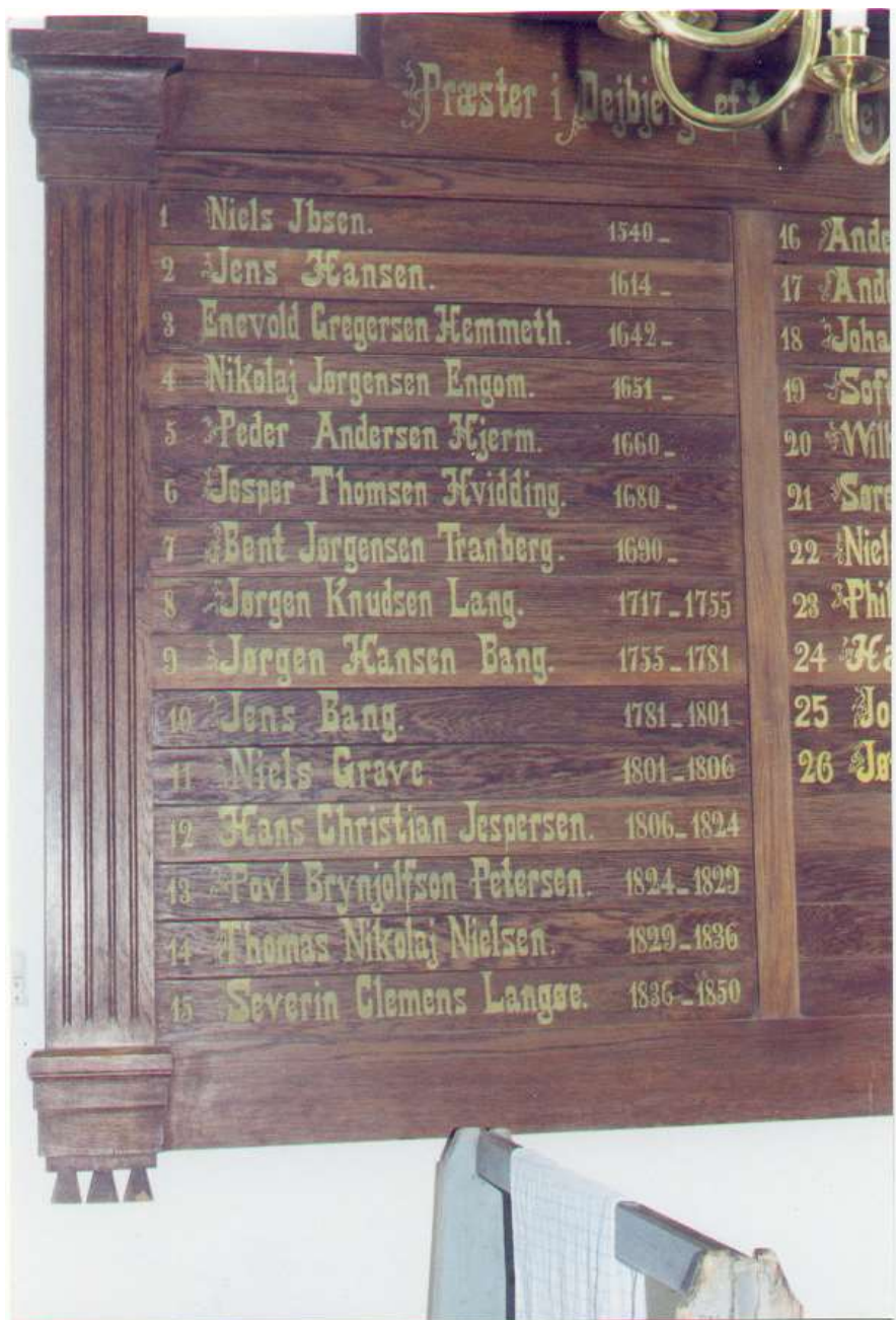
Præsterække i Deibjerg kirke

Mens de har boet i Deibjerg har de formentlig 2 gange oplevet krigens rædsler, dels under Danmarks deltagelse i 30-års krigen fra 1625 til 1629, der i 1626 afstedkom Wallensteins plyndringer i Jylland, og dels under Torstensson-krigen fra 1643 til 1645.