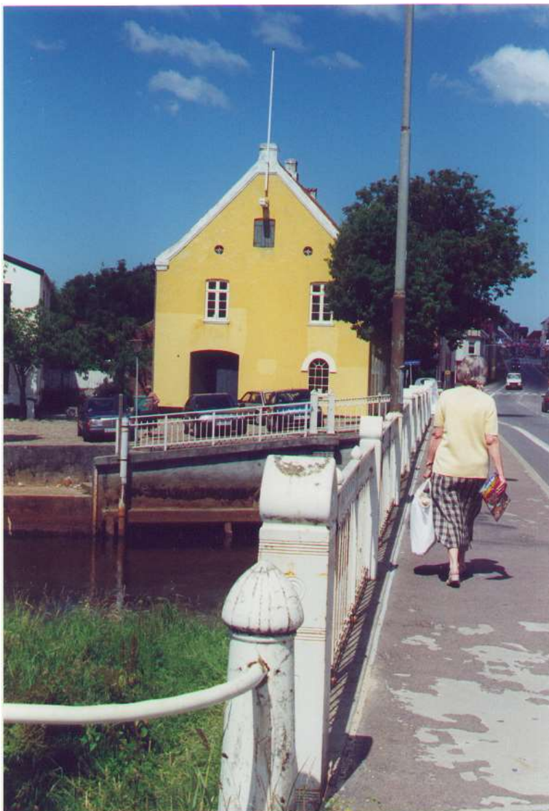
Den gamle toldbod i Varde

(Underskrevet) Hans Fredrigsen, egen haand.