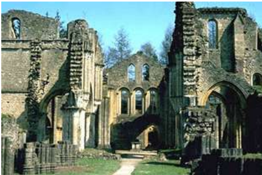
Ruinerne af det gamle Orval munkekloster syd for Florenville