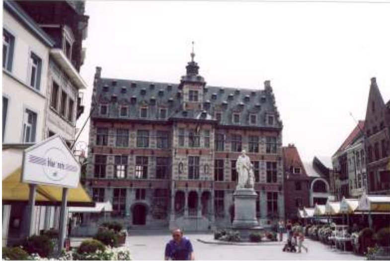
Hal rådhus – set fra basilikaen