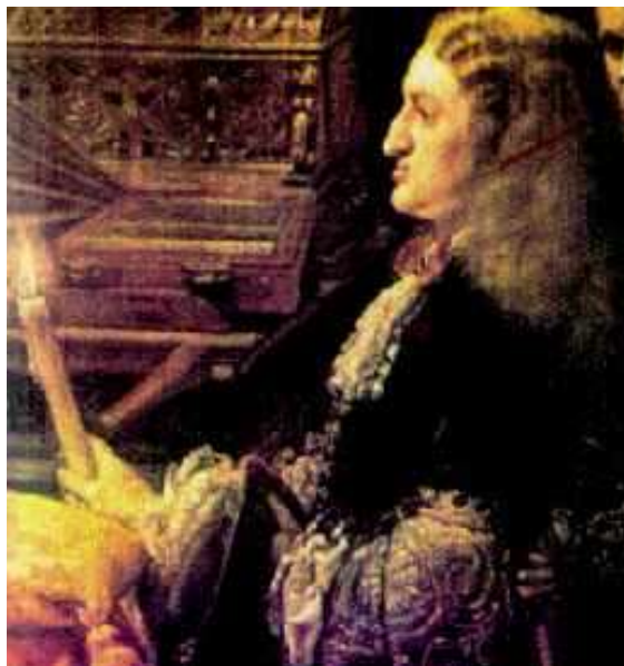
Karl II af Spanien