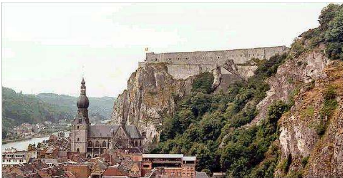
Citadelle de Dinant

Den første fæstning i Dinant blev bygget på den 100 meter høje klippetop over floden La Meuse i 1051 af Nithard, der var biskop af Liège, for at forsvare floden mod indtrængende fjender.