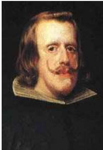
Kong Felipe IV af Spanien