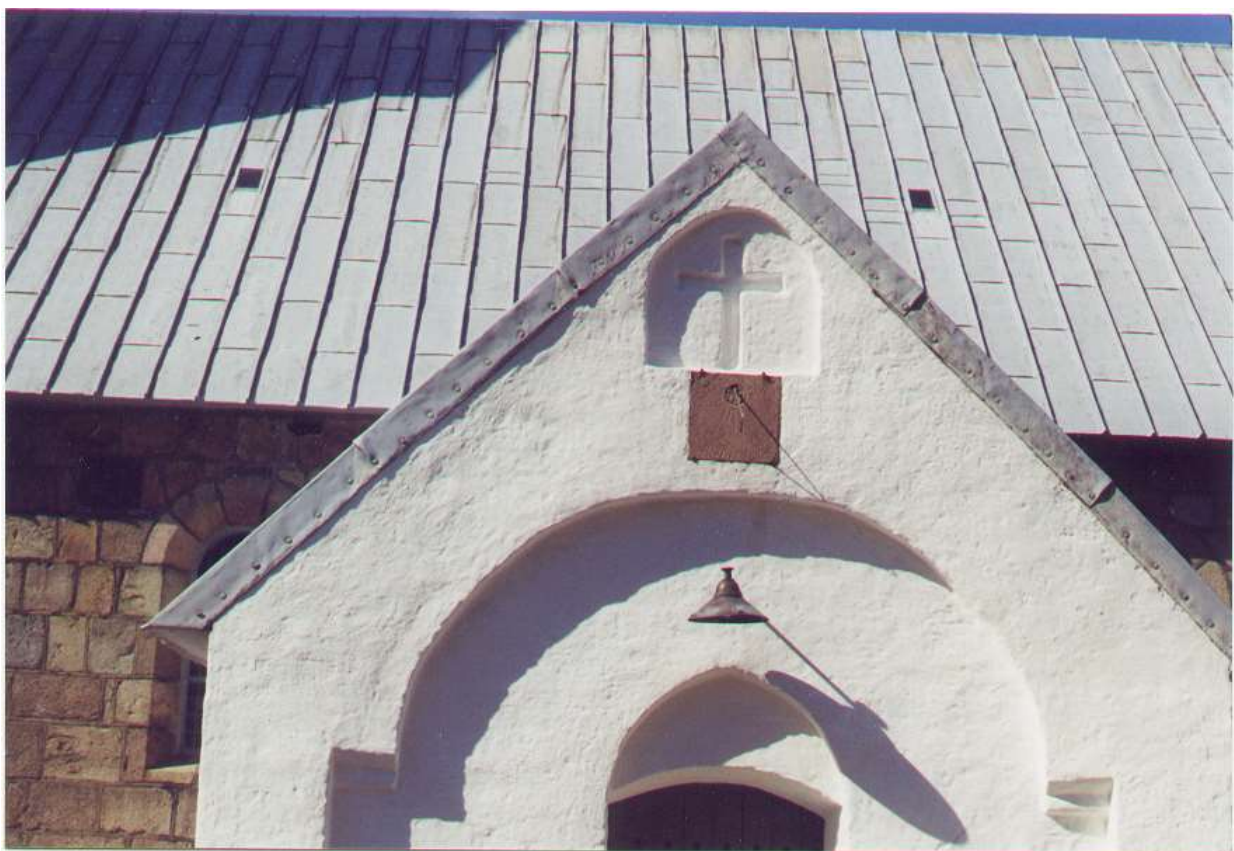
Dejbjerg kirkes våbenhus med solur. Den ældste del af kirken stammer fra 1150.

Christian V (1670-1699) var den ældste søn af Frederik III og dronning Sofie Amalie, født 1646 på Flensborghus slot. Han blev allerede i 1655 hyldet som tronfølger i København. I 1667 blev han gift med Charlotte Amalie af Hessen-Kassel. Det forhindrede ham dog ikke i 4 år efter at tage sig en elskerinde, Sofie Amalie Moth, der var datter af hans fars livlæge. Hun blev i 1676 anerkendt som kongens "maitresse".