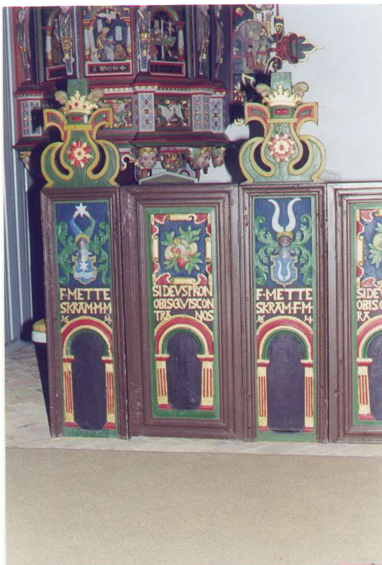
Udsmykning fra 1614 af de gamle herskabsstolestader i Dejbjerg kirke