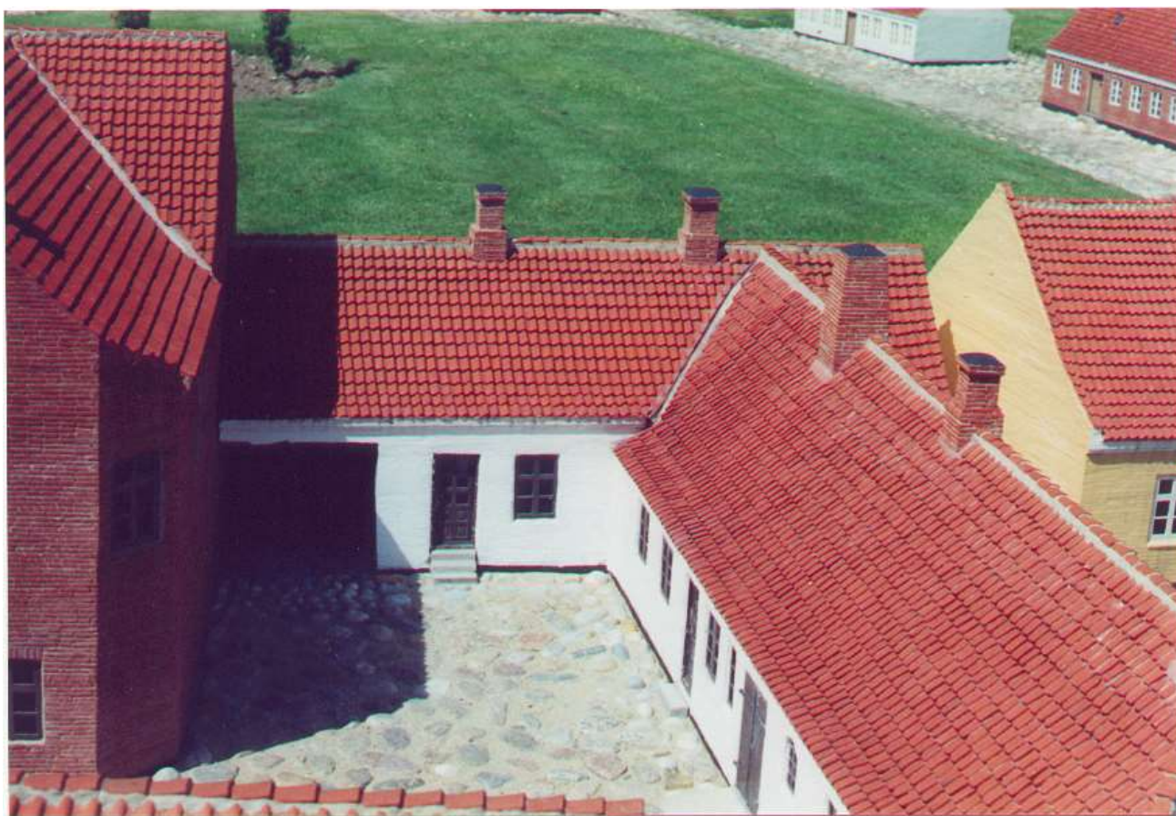
Kræmmergade nr. 6 – i minibyen i Varde - set fra gårdsiden