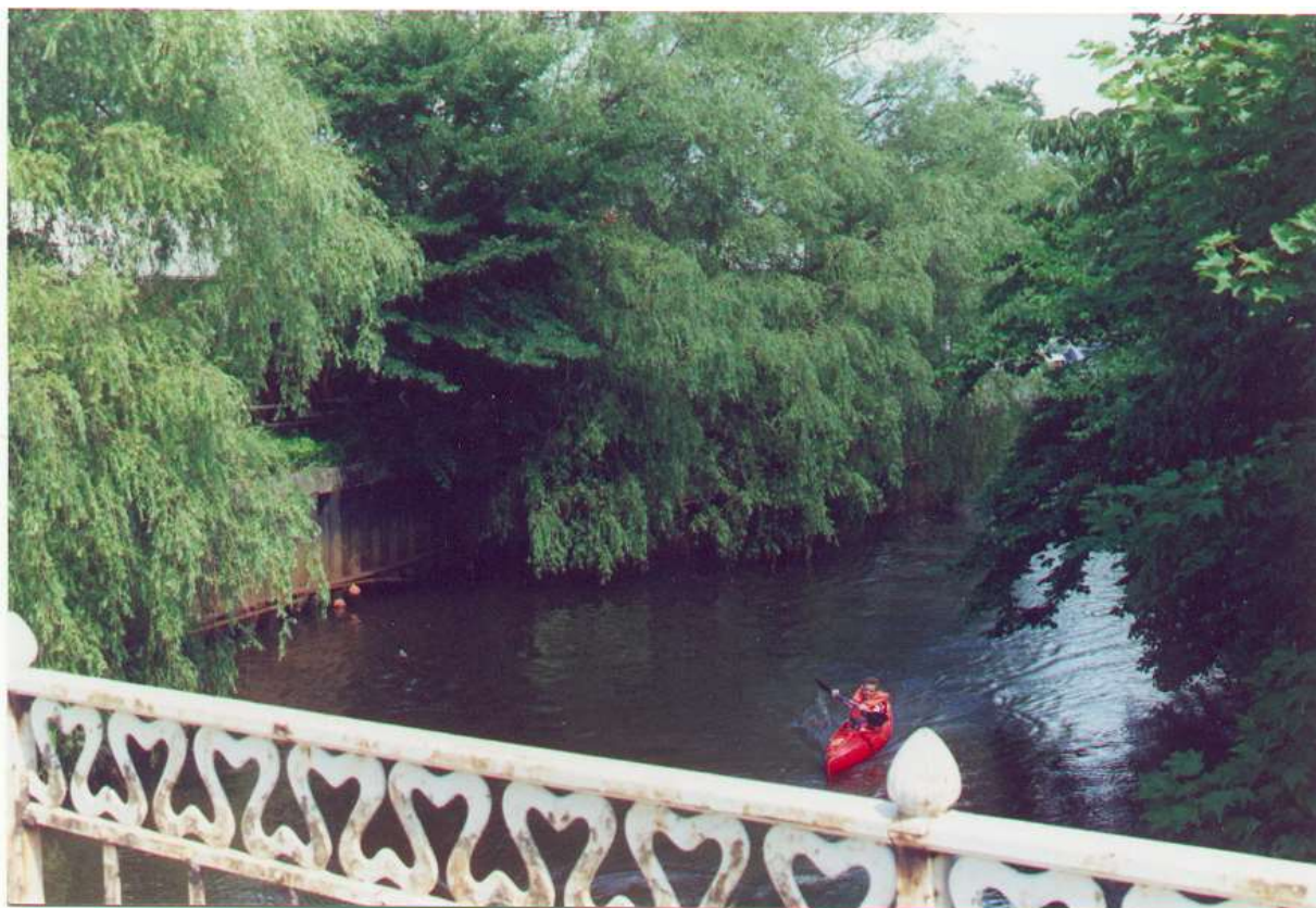
Bleghafue (bag træerne) ved Varde å – anno 1997. Hotel Phønix eksisterer ikke mere.

En del af overkæmner-lønnen har været brugen af nogle af byens enge. Fra 1645-1648 er engene Bleghaffue og Suderhaffue således bevilget "Terkell Turesen for sin umage". Bleghaffue havde i 1819 matrikel nr.11b, og Suderhaffue matrikel nr. 145b. De lå på hver sin side af Ribe-landevejen syd for Sønderport, på nordsiden af Varde å og helt ned til denne. Suderhaffue lå vest for landevejen, og Bleghaffue øst for. Omtrent hvor Bleghaffue lå befandt sig senere (endnu i 1942) hotel Phønix.