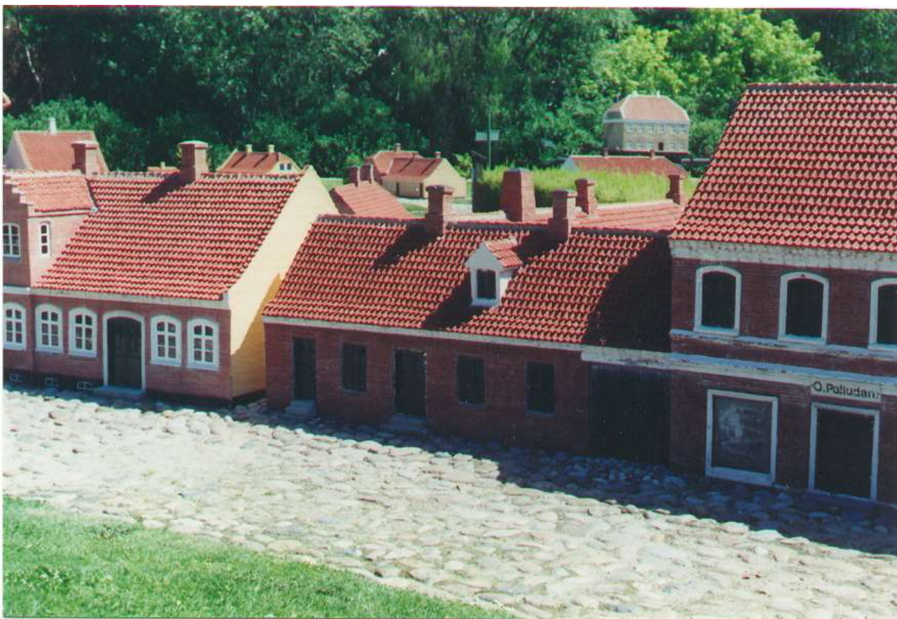
Kræmmergade nr. 6 – i minibyen i Varde – omkring år 1800

"Befindis derudi (i byen) en ringe menighed och næring, dets gaarde och huse som miesteparten er gandske ringe biugning med straatag og liervegge, ilde ved magt, och en deel slet ruineret, och øde, eftersom samme by ligger ret paa landevejen fra Ribe ind ad landet, och haffuer af deres mark udi forleden fryde tid lid stoer skaade".