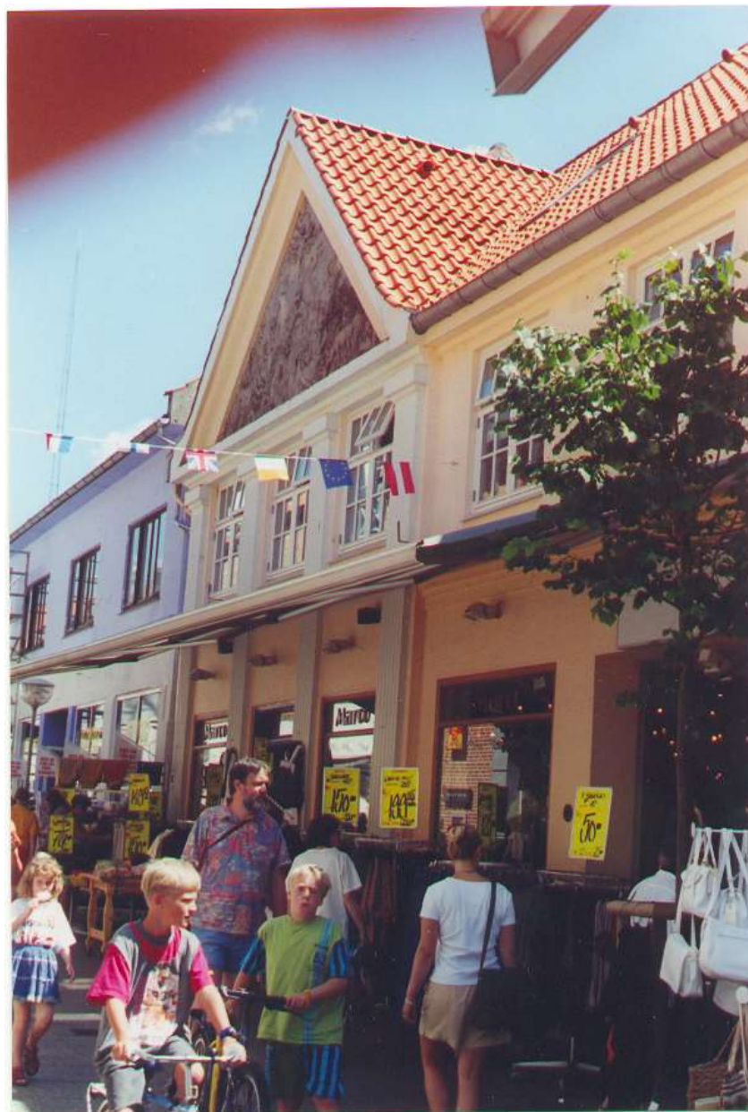
Kræmmergade nr. 6 (gavlhuset) anno 1997