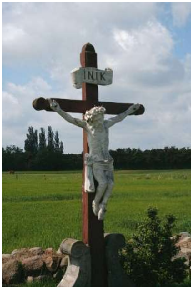
Krucifikset mellem Rynkeby og Skovsbo

Af og til kan man på de danske landeveje støde på noget, man normalt kun ser i de katolske lande, nemlig vejkrucifikser. Mange af disse er sat op i begyndelsen af det 19. århundrede, men der findes også ældre.