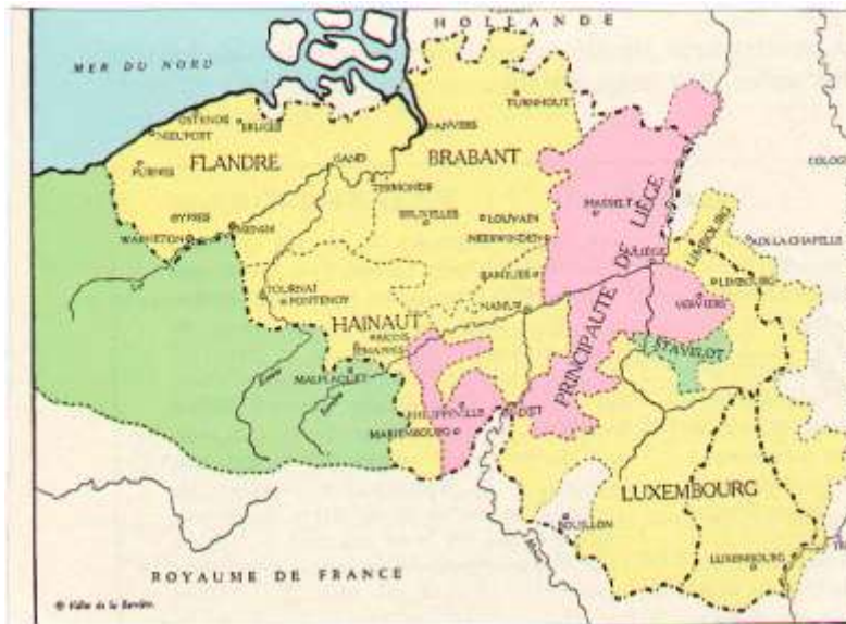
De østrigske Nederlande 1714-1794.