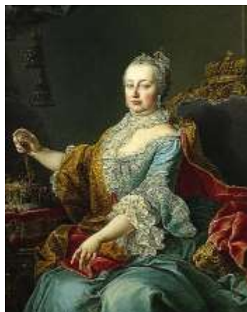
Maria Theresia, 1740-1780