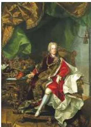
Karl VI, 1714-1740