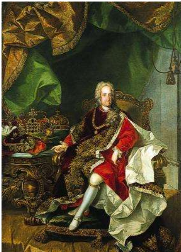
Karl VI, østrigsk kejser 1711-1740, født 1685.