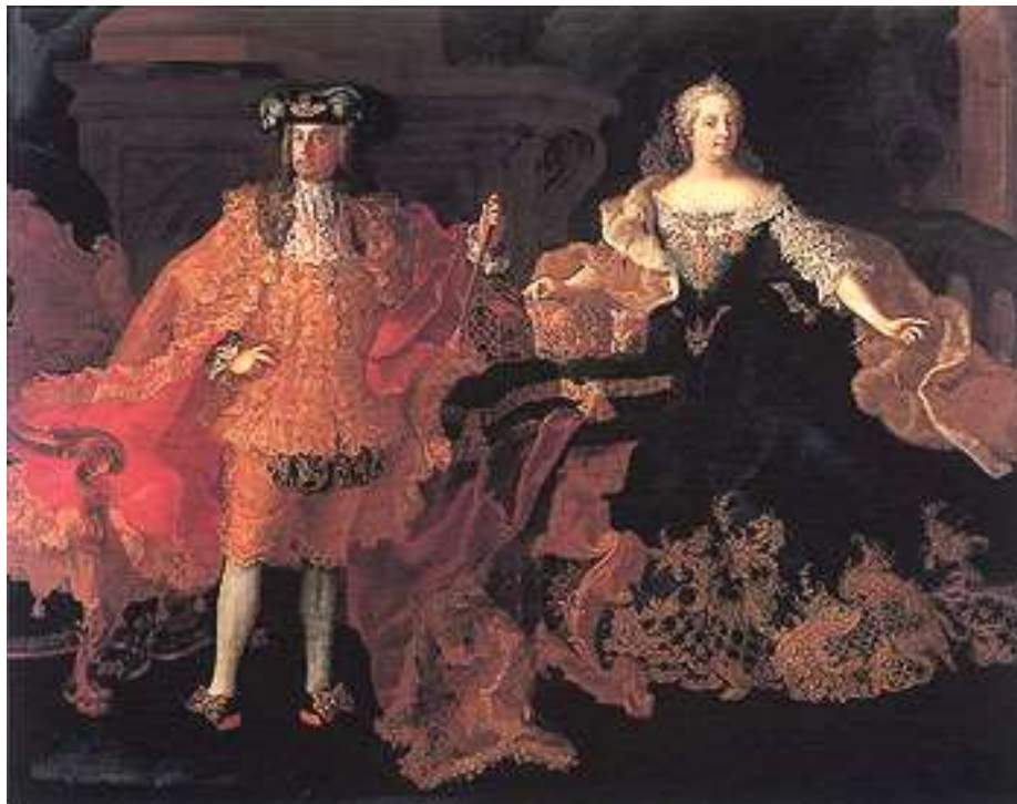
Frans I og Maria Theresia