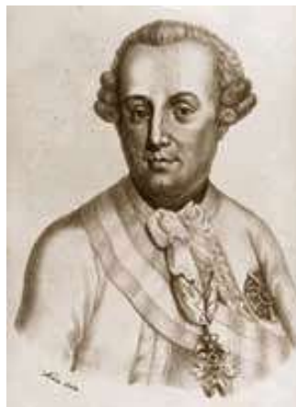
Charles de Lorraine