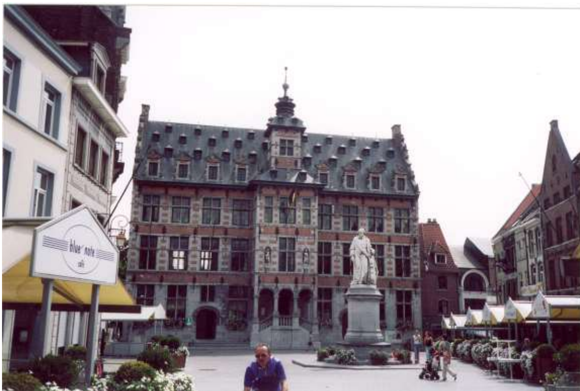
Rådhuset i Hal, der ligger over for basilikaen