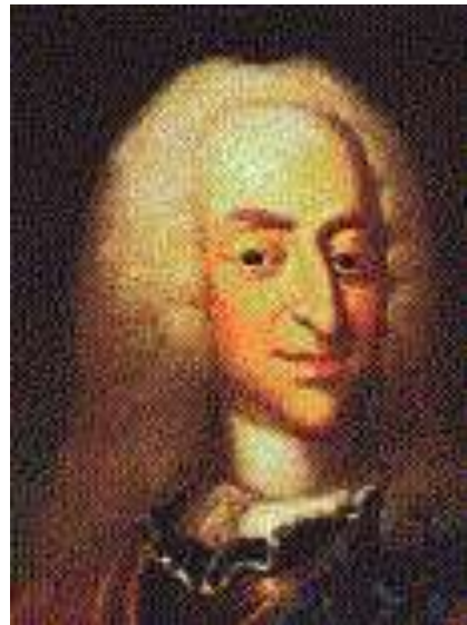
Christian VI af Danmark 1730 – 1746