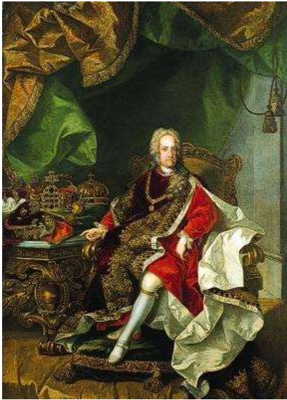
Kejser Karl VI – også af Nederlandene 1711 – 1740