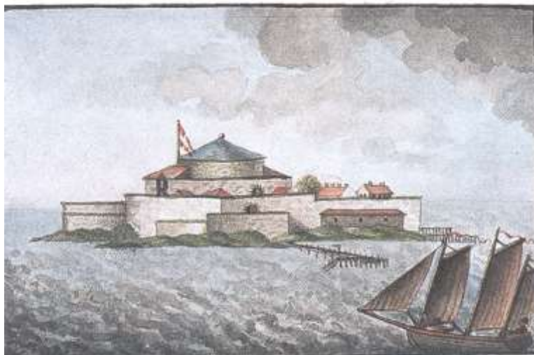
Fæstningen Munkholm i Trondhjemfjorden