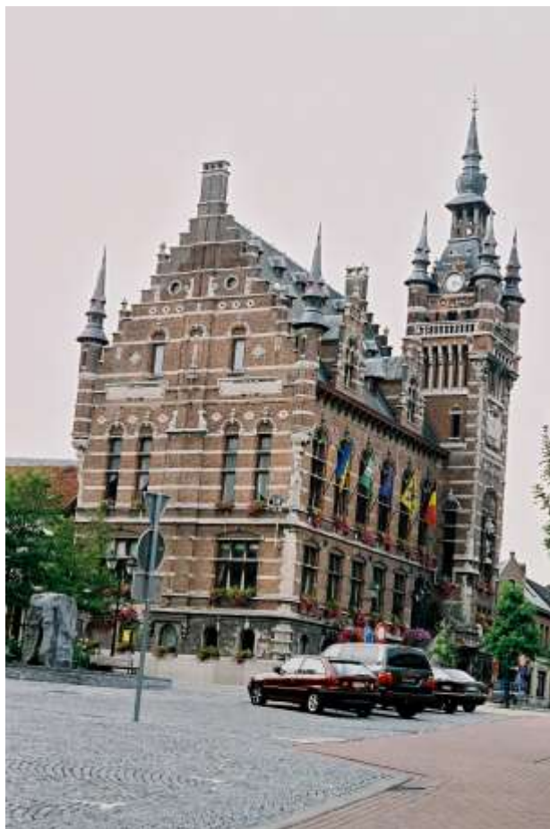
Temse rådhus 2003