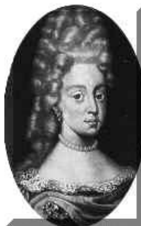
Nederlandene i den 2. østrigske periode 1714-1794