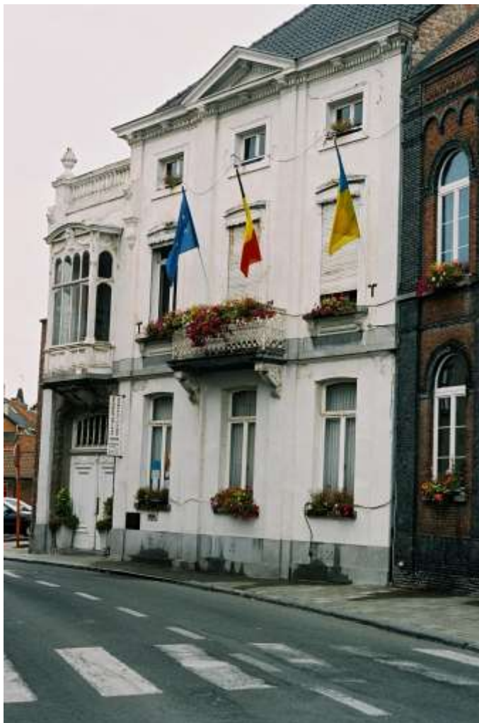
Thielrode rådhus 2003